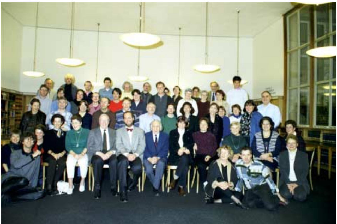
Das Personal der ZHB im Januar 1999, vereint mit bereits pensionierten Ehemaligen