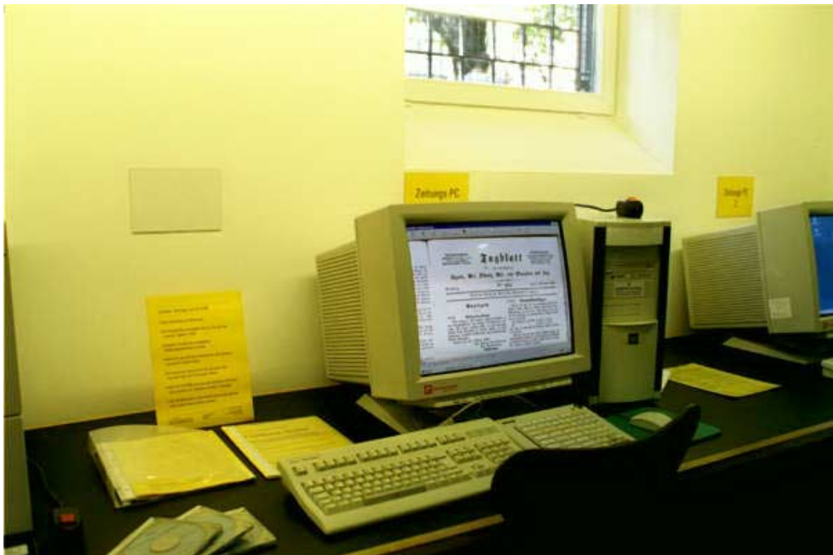
Im Multimedia-Raum: Die neuen Arbeitsplätze für die Konsultation der digitalisierten Zeitungen